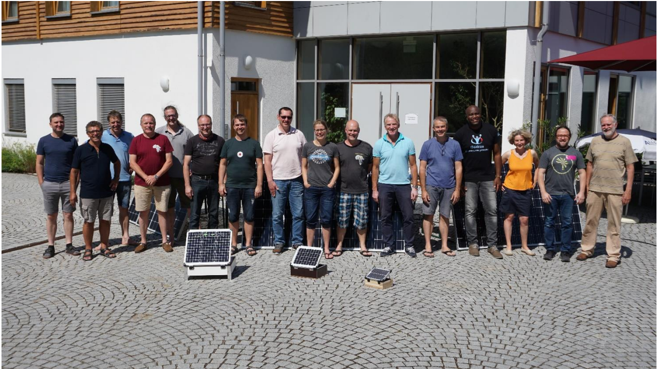
L'équipe de VET4Africa

plateforme. En outre, le site web www.vet4africa.com et une chaîne YouTube ont été créés. Cette année, la formation complète ainsi qu'une grande partie de la coordination ont eu lieu par le biais de conférences web. L'objectif des formateurs allemands dans les écoles professionnelles est de soutenir les collègues africains dans le domaine du photovoltaïque et des énergies renouvelables et de montrer comment la technologie moderne peut être utilisée pour rendre l'énergie du soleil utilisable par tous. Grâce aux nouveaux médias, les contenus peuvent être utilisés à des fins de formation sur place et les connaissances sont transmises par l'intermédiaire des multiplicateurs.